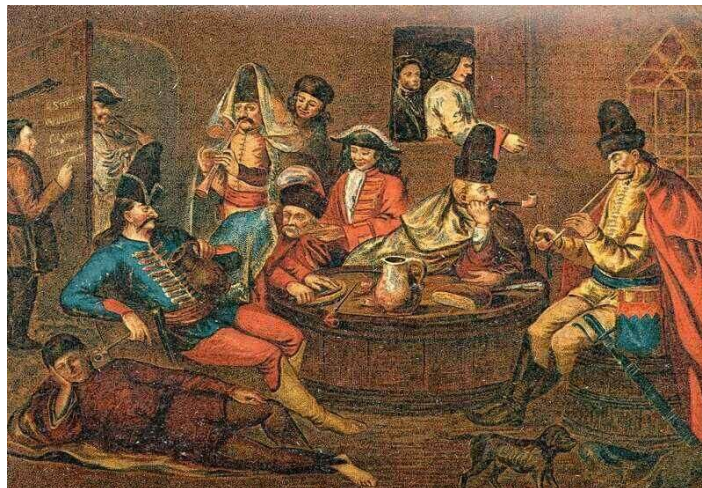
Iszogató, pipázó, tárogatómuzsikát hallgató kurucok - olajfestmény Acsády Ignác: Magyarország története I. Lipót és I. József korában In: A magyar nemzet története. Szerkesztette: Szilágyi Sándor. Athéneum, Budapest, 1898, VII. kötet, 620. oldal utáni tábla.

A legképzettebbek, legfegyvelmezettebbek, és legjobban felszerelt csapatok az udvari hadak voltak. A fejedelem személyes hadseregét képezték, fenntartásukat saját birtokainak jövedelméből fedezte. Nyalka, színes ruházatú, pompás fegyverzetű kurucok voltak. Az udvari had volt az elit, olyan csapatok tartoztak ide, mint a palotás ezred, a zöld vadászok kompániája, a nemesi kompánia vagy a székely kopjás ezred.