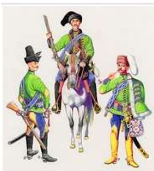
Palocsai György lovasezrede (1706)

A fejedelem hadseregének zömét a könnyűlovasság alkotta. Bányai Elemér leírása szerinti öltözéke: abaposztóból szabott dolmány, sarkantyús csizma, föveg, tarsoly, fehér vagy vörös kerek köpönyeg, forgós kalpag. Fegyverzetük: fringakard, háromélű dragony, párpisztoly, karabély. A lovasság alapalakulata a kompánia volt. Egy lovasezred 10 századra oszlott, századonként 80-100 fő, 3 tizedes, 1 őrmester, 1 zászlótartó, egy fő- és egy alhadnagy, egy-egy furir (seregdiák), sebész, trombitás, nyeregkartó és kovács.