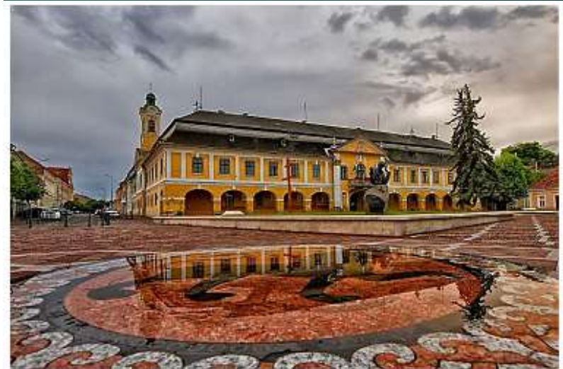
A Bottyán-palota ma az esztergomi városháza

Emlékére Tarnaörsön, az egykori kuruc tábor helyén kopjafát emeltek, amelyet évente szeptember 26-án ünnepi megemlékezés keretében megkoszorúznak.